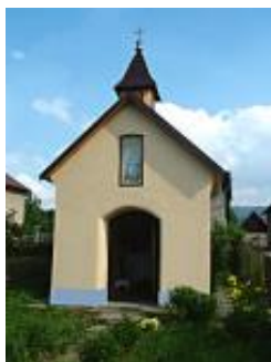
Kaplnka u Matuška