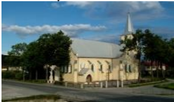
Rímsko-katolícky kostol Narodenia Panny Márie z roku 1874