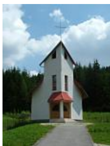
Kaplnka v miestnej časti u Blažička z roku 2002