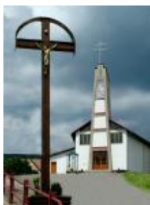
Kostol sv. Cyrila a Metoda v Rakovej – Korcháni z roku 1991